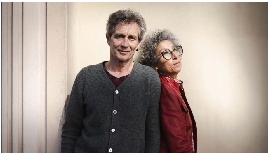
Héla Fattoumi & Éric Lamoureux

Deux week-ends « Carte blanche » dédiés à Héla Fattoumi et Éric Lamoureux, chorégraphes passionnés des Ailleurs et des altérités.